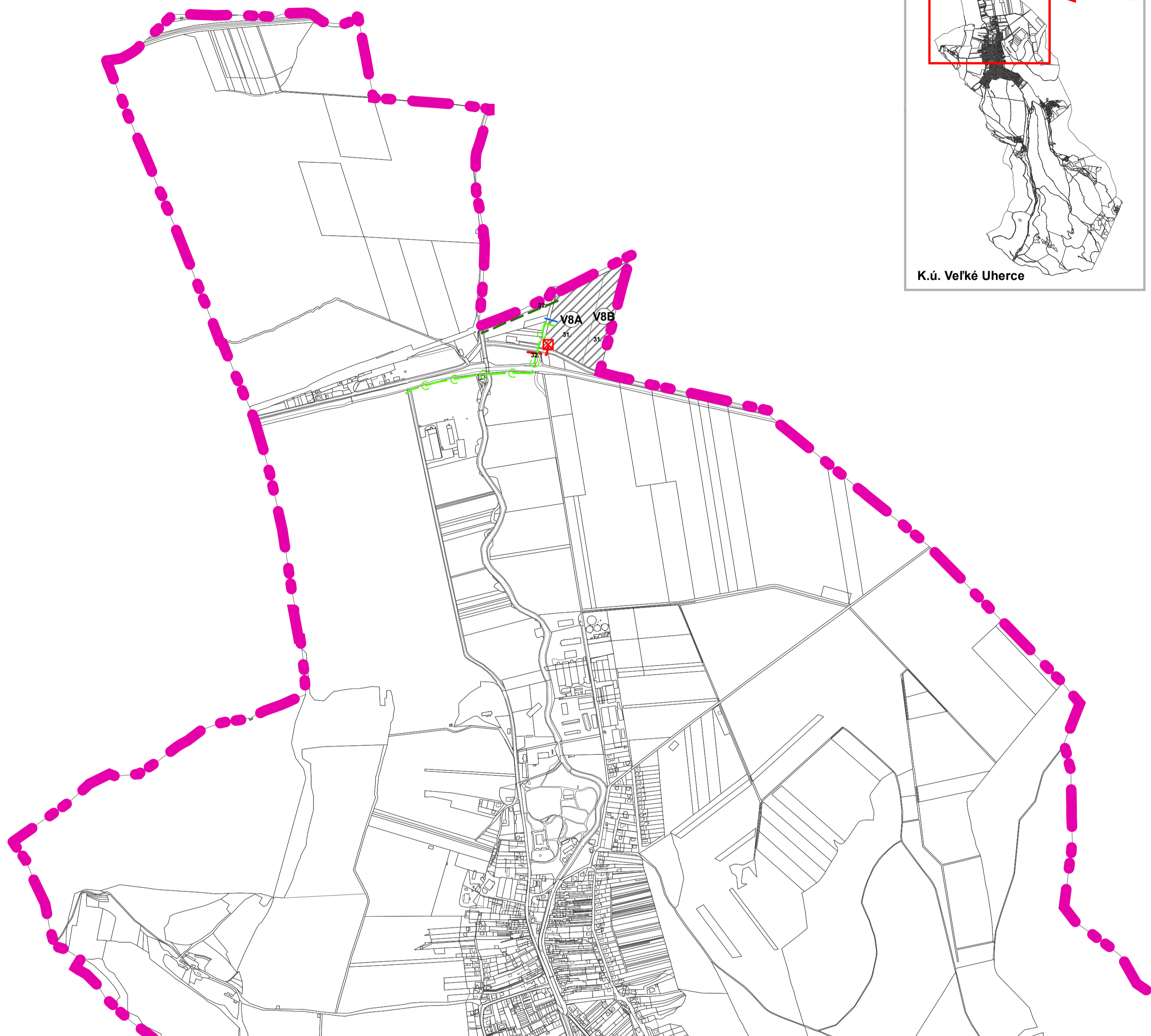
SCHÉMA ZÁVÄZNEJ ČASTI ÚPN-O VEĽKÉ UHERCE - NÁLOŽKA NÁVRH